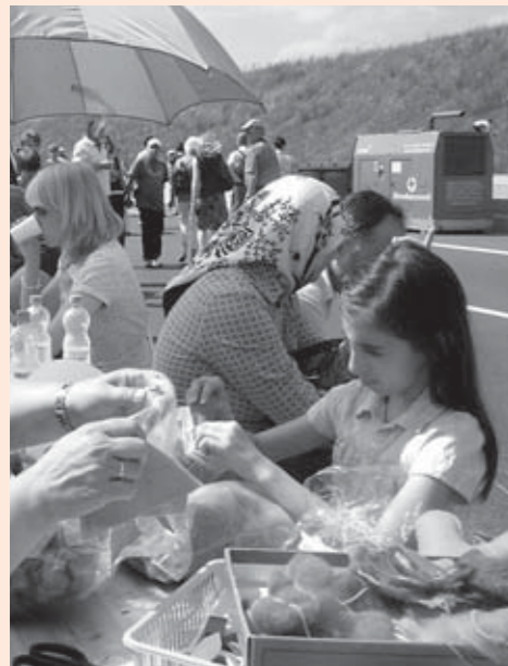
Filzen auf der Autobahn

Der Paritätische in Dortmund war ganz aktiv dabei