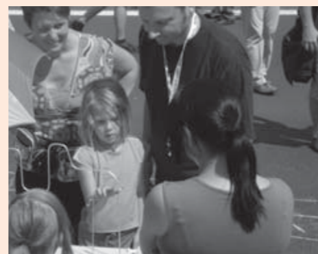
Der heiße Draht fordert Konzentration

auch zum Sommerhit der Fußball WM getanzt. Großen Zulauf und Erfolg hatte das Angebot „Filzen“ der Schragmüller OGS. Mit Ausdauer und Geduld wurden z.B. farbenfrohe Fische erstellt. Eine alte Kulturtechnik, das Stricken, konnte mit Rundstricknadeln oder der Strickliesel durchgeführt werden. Die Einzelteile werden zu einem bunten paritätischen Schal zusammengefügt. Alles in Allem ein toller und nachhaltiger Spaß und Erfolg. ■ Kludia Weindorf