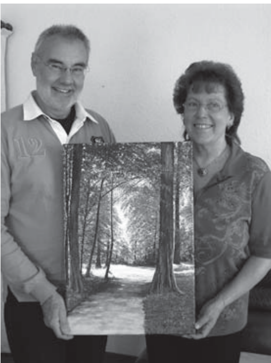
Der Kunstmaler und die Jubilarin mit dem Überraschungsgeschenk

1998 kam ich als Betroffene in die Selbsthilfegruppe für Menschen mit chronischen Schmerzen. Ich war hilflos und suchte Auskünfte über Therapiemöglichkeiten und versierte Ärzte in der Gruppe, die bereits seit zwei Jahren gemeinsam Erfahrungen austauschten. Dass sich daraus ein jahrelanges aktives Miteinander mit Gleichbetroffenen ergeben hat, damit hatte ich nicht gerechnet.