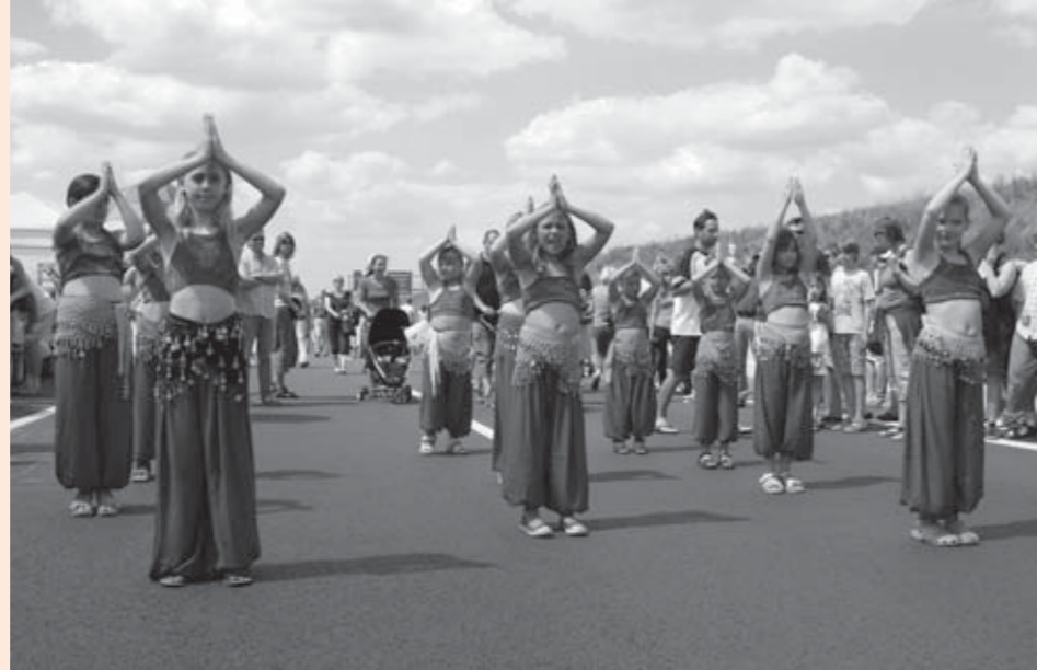
Es gab viel Applaus für die Bauchtanzgruppe der Langeloh OGS

Unmittelbar an der Auffahrt Dortmund-Dorstfeld haben Mitarbeiterinnen und Kinder des offenen Ganztages (OGS) zur größten Party des Jahres beigetragen. Beim „heißen Draht“ der Bach OGS konnten Kinder und Erwachsene ihre Geschicklichkeit und Koordination ausprobieren. Es zeigte sich, dass unser „Heißer Draht“ sogar bis ganz nach oben reicht, denn das Wetter hat wunderbar mitgespielt. Die Bauchtanzgruppe der Langeloh OGS zog viele Zuschauer in ihren Bann, es wurde