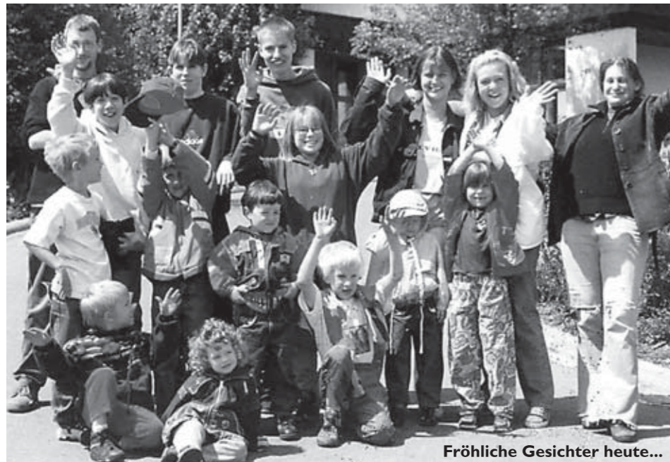
Fröhliche Gesichter heute...

Was im Jahre 1982 zunächst als Erfahrungsaustausch in ersten zunächst unregelmäßigen Zusammenkünften begann, entwickelte sich rasch zu einem Verein, der 1985 offiziell als „ELTERNTREFF Leukämie- und tumorerkrankter Kinder e.V.“ eingetragen wurde. Mit Stolz können wir heute feststellen, dass sich unser als gemeinnützig anerkannter Verein in den 25 Jahren des Bestehens zu einer anerkannten Interessenvertretung für krebserkrankte Kinder, die in der Dortmunder Kinderklinik behandelt werden, entwickelt hat.