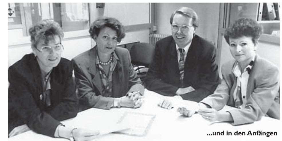
...und in den Anfängen

Nach gut 22jähriger Nutzung zeigte diese ehemalige Vorzeigestation „K1“ dann jedoch deutliche Verschleißerscheinungen - eine erneute Renovierung war dringend erforderlich. Bei deren Planung, Gestaltung und Finanzierung war der ELTERNTREFF auch diesmal wieder aktiv mit eingebunden. Die neue „Kinder-Elterntreff-Oase“ inmitten der Station wird als Begegnungsstätte mit vielen Möglichkeiten zum Auftanken gut angenommen.