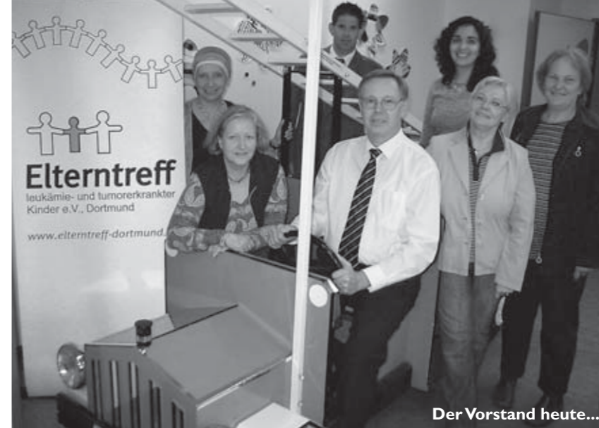
Der Vorstand heute...

methoden, zu Ernährungsfragen, zum Stand der Forschung, zu Problemen in der Schule, zur Psychosozialen Betreuung, zu Sozialen Hilfen, gehören bis heute zu den Klassikern des Vereins. Jahrelang wurden ferner intensive Kontakte zwischen dem ELTERNTREFF und der Elterngruppe der Dortmunder Partnerstadt Rostow am Don (Russland) gepflegt.