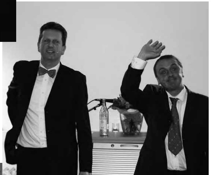
Für ausgelassene Stimmung sorgte der Auftritt der Kabarettisten Funke und Rüther, die in ihr neues Programm „Scharf gemacht“ Pointen rund um das Thema Selbsthilfe einbauten.