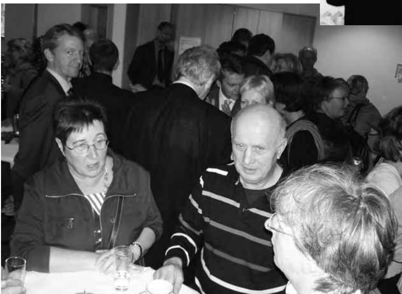
Nach dem Jubiläumsbrunch gab es die Gelegenheit zum Gespräch und so herrschte bis zum Ende der Veranstaltung ein reger Austausch.