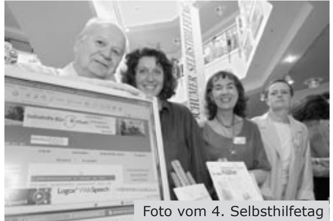
Foto vom 4. Selbsthilfetag

der 5. Bochumer Selbsthilfetag steht vor der Tür. Am Samstag, den 04. August 2007 von 10.00 bis 18.00 Uhr stellen sich wieder Selbsthilfegruppen in der Drehscheibe beim 5. Bochumer Selbsthilfetag vor. Im Einkaufszentrum in der Kortumstraße präsentieren sich diesmal 52 Gruppen. Besucherinnen und Besucher werden sich unter anderem über Restless Legs, Aufmerksamkeitsdefizitsyndrom, Schlafapnoe oder Suchtabhängigkeiten informieren können. Die Vielfalt der Selbsthilfethemen in Bochum ist erstaunlich. Interessierte, die sich schon vor dem Selbsthilfetag über Selbsthilfe oder die Erreichbarkeit einer bestimmten Gruppe informieren möchten, bekommen Auskunft im